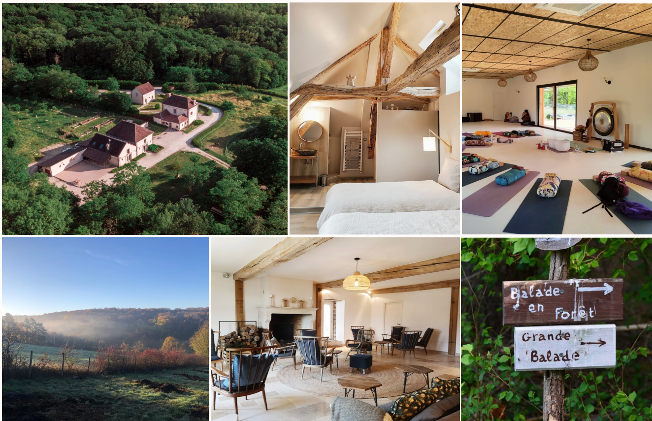
La Tuilerie de Talouan, 89500 Villeneuve-sur-Yonne

De paris : 1 heure 30 min de voiture ou de train